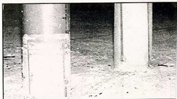
Des tuyaux en PVC ont été plantés dans le sol pour permettre l'évacuation des gaz