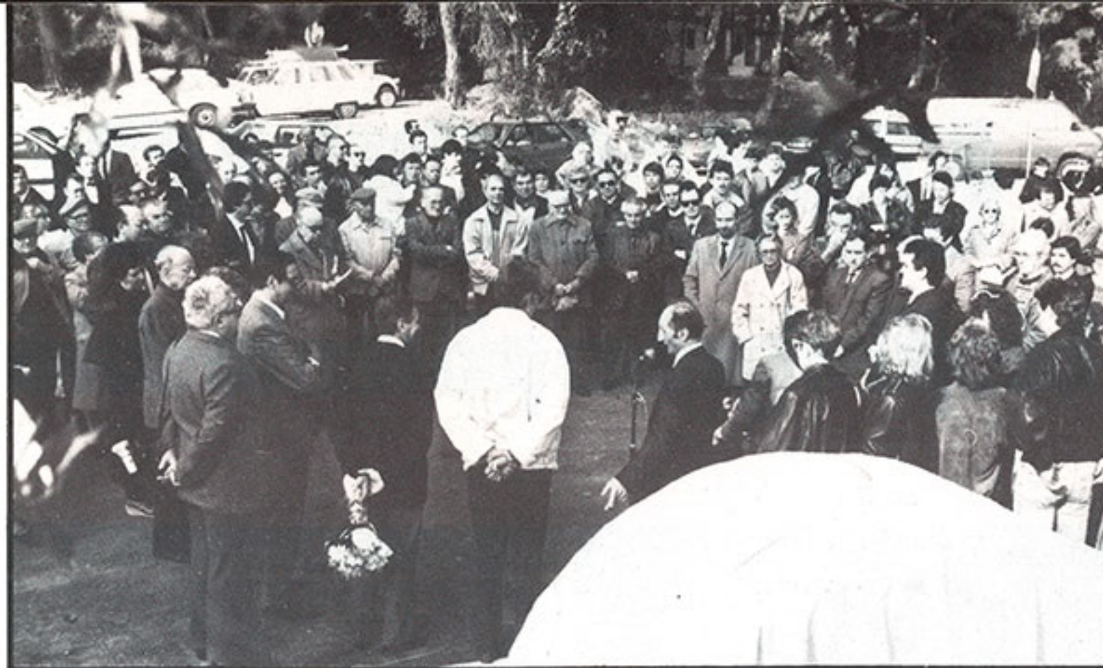
14 janvier au matin : une plaque portant le nom d'André Vanco est dévoilée à l'entrée du complexe.

Ce jour là, étaient mis en service les deux premiers courts de tennis du complexe. Dans le même temps, était dévoilée une plaque portant le nom d'André Vanco, Maire de Beausoleil et Conseiller Général de 1971 à 1986. Pour cette émouvante cérémonie, de nombreux Beausolleillois avaient tenu à se rendre au Devens afin de rendre hommage à celui qui avait été le promoteur d'un ensemble remarquable, tant par la qualité des installations que par la situation exceptionnelle dans l'un des plus beaux paysages de l'hexagone.